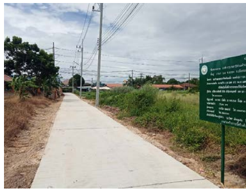
๑๓. โครงการก่อสร้างถนนคอนกรีตเสริมเหล็ก ซอยหัวทุ่ง ๘ หมู่ที่ ๔ บ้านหัวทุ่ง งบประมาณ ๑๔๐,๑๐๐บาท เบิกจ่าย ๑๓๙,๒๐๐ บาท