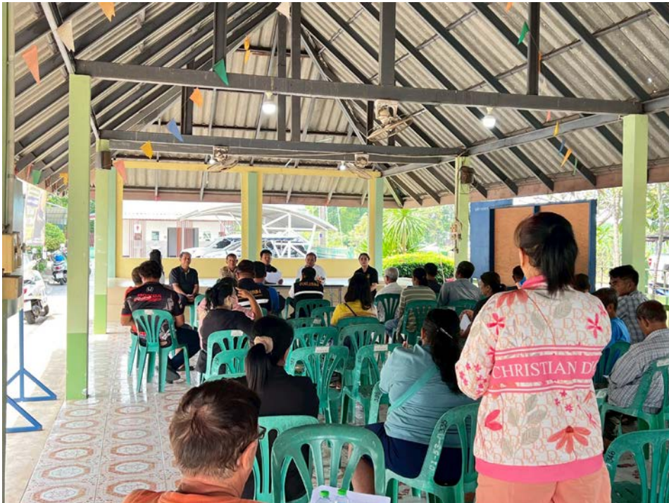
หมู่ที่ 5 บ้านเขาโบริสต์ เวลา 13.00 น. ณ ศาลาประชาคมหมู่บ้าน